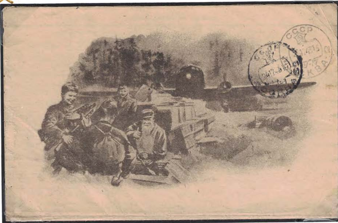
Секретка с партизанским сюжетом из полевой почты № 05229 (15.12.1943 г.) в Москву (24.12.1943 г.). Просмотрено военной цензурой 03974

«Методы малой войны используются противником с большим мастерством, в результате чего мы потеряли 800 героев убитыми». Так оценил враг действия партизанского соединения Сабурова А.Н.