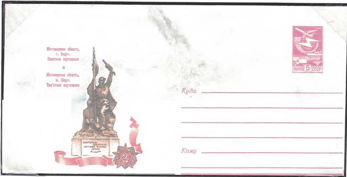
В 1983 г. издан ХМК с рисунком В. Коновалова

В ходе боев погибли 43 партизана, в том числе командир Чехословацкого отряда Ян Нелепка (Репкин), который удостоен звания Героя СССР, а в Словакии его именем назван город (Нелепка).