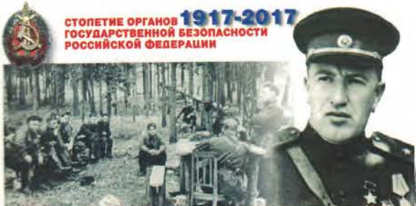
САБУРОВ АЛЕКСАНДР НИКОЛАЕВИЧ - ГЕРОЙ СОВЕТСКОГО СОЮЗА, ГЕНЕРАЛ-МАЙОР, СОТРУДНИК НКВД

СТОЛЕТИЕ ОРГАНОВ ГОСУДАРСТВЕННОЙ БЕЗОПАСНОСТИ РОССИЙСКОЙ ФЕДЕРАЦИИ 1917-2017