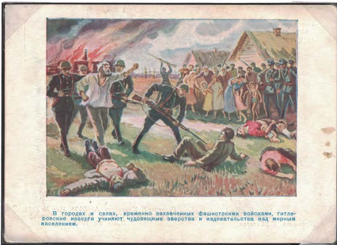
В городах и селах, временно захваченных фашистскими войсками, гитлеровские изверги учиняют чудовищные зверства и издевательства над мирным населением.